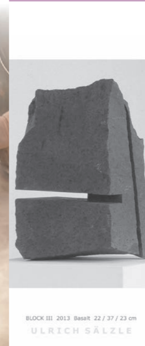
BLOCK III 2013 Basalt 22 / 37 / 23 cm ULRICH SÄLZLE